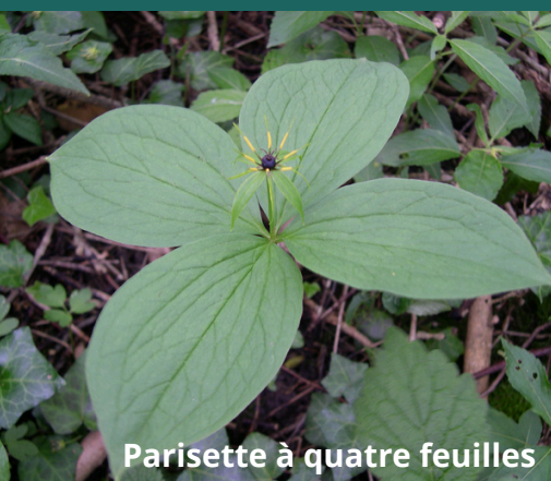
Parisette à quatre feuilles

L' Anémone sylvie apprécie des bois humides et est indicatrice des forêts anciennes. La Parisette à quatre feuilles fréquente les mêmes types de milieux et est déterminante pour les ZNIEFF (Zones Naturelles d'Intérêt Écologique, Faunistique et Floristique). Les deux espèces présentent peu de risques de confusion. L'Anémone sylvie est plus fréquente que la Parisette à quatre feuilles , ce que l'on retrouve dans les données récoltées avec 910 Anémones contre 243 Parisettes .